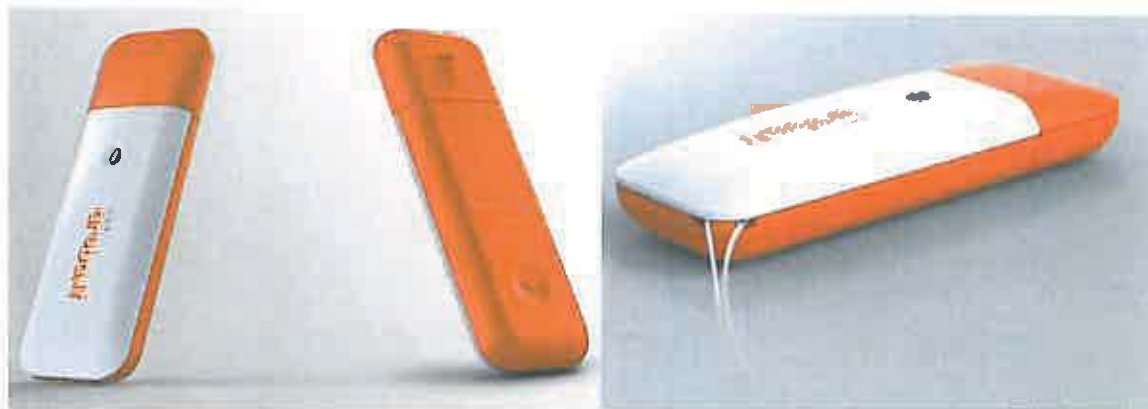
Fig. 2 Esempi di ArubaKEY.